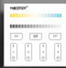
B2 / T2