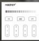
B1 / T1